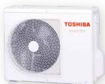
Venkovní jednotka (příklad)