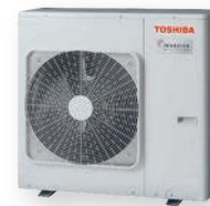
RAS-3M26G3AVG-E* RAS-4M27G3AVG-E* RAS-5M34G3AVG-E*